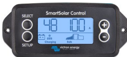
Écran enfichable SmartSolar