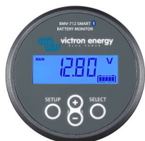
Détection Bluetooth BMV-712 Smart Battery Monitor