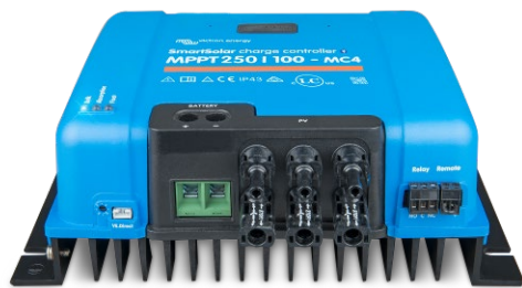
Contrôleur de charge SmartSolar MPPT 150/100 MC4 sans écran