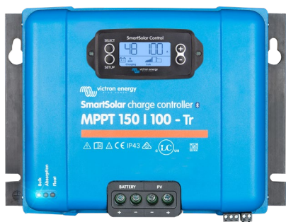
Contrôleur de charge SmartSolar MPPT 150/100-Tr avec un écran enfichable en option