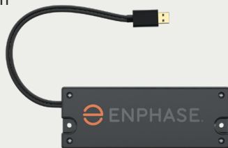
Kit de communication

mandé d'installer les IQ Batteries dans la même pièce que l'IQ Gateway afin d'assurer une communication optimale.